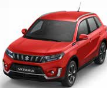
Bright Red 5 (ZCF) (1)