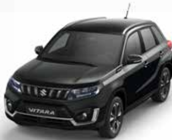
Cosmic Black Pearl Metallic (ZCE) (1)(2)