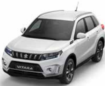
White (26U) (1)