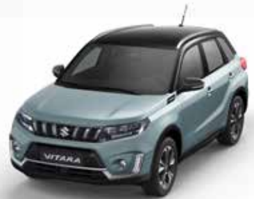
Wagenfarbe: Ice Grayish Blue Metallic (ZZD) und Dachfarbe: Cosmic Black Pearl Metallic (ZCE) Farbcode: DBF (2)(3)