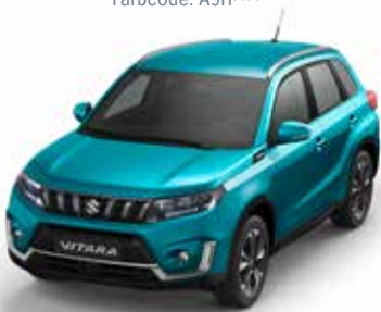
Atlantis Turquoise Pearl Metallic (ZQN) (1)(2)