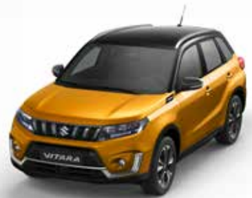
Wagenfarbe: Solar Yellow Pearl Metallic (ZZE) und Dachfarbe: Cosmic Black Pearl Metallic (ZCE) Farbcode: DBH (2)(3)