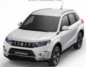
Cool White Pearl (ZNL) (2)