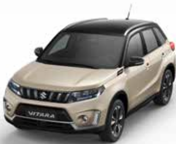
Wagenfarbe: Savanna Ivory Metallic (ZQQ) und Dachfarbe: Cosmic Black Pearl Metallic (ZCE) Farbcode: A9N (2)(3)