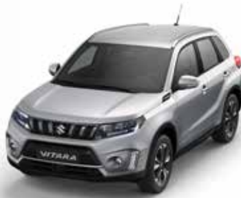
Silky Silver Metallic 2 (ZCC) (1)(2)