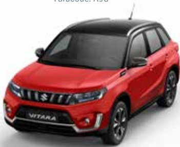
Wagenfarbe: Bright Red 5 (ZCF) und Dachfarbe: Cosmic Black Pearl Metallic (ZCE) Farbcode: A9H (2)(3)