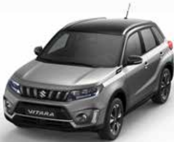
Wagenfarbe: Galactic Gray Metallic (ZCD) und Dachfarbe: Cosmic Black Pearl Metallic (ZCE) Farbcode: A9G (2)(3)