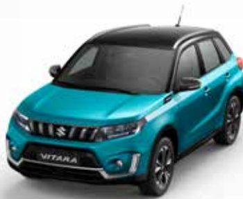
Wagenfarbe: Atlantis Turquoise Pearl Metallic (ZQN) und Dachfarbe: Cosmic Black Pearl Metallic (ZCE) Farbcode: A9L (2)(3)